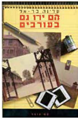
עטיפת הספר "הם ירו גם בעורבים" מאת עדינה בר-אל