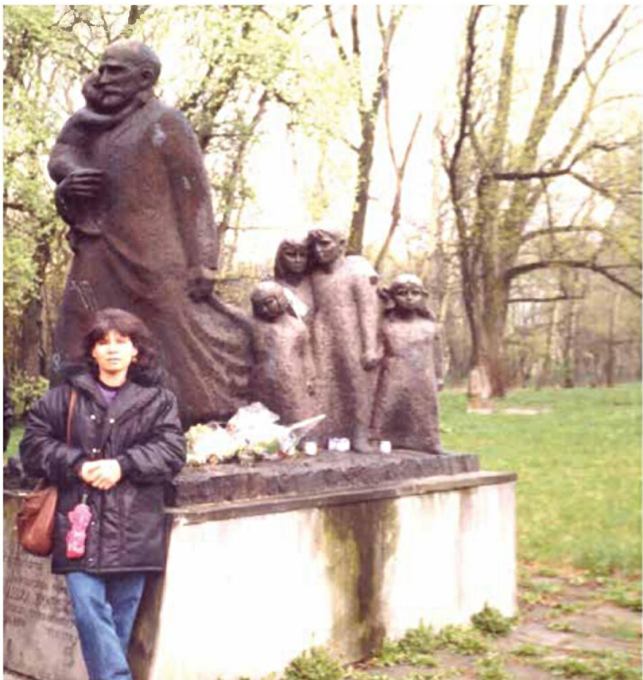
ליד פסלו של יאנוש קורצ'ק בבית הקברות היהודי בוורשה (1990).

אבל מה שהביא אותי להחלטה חדשה בחיים היה הביקור בבית הקברות היהודי בוורשה. דווקא שם, בעולם המתים, למדתי על עולם החיים היהודי שהיה קיים לפני השואה בפולין. היו שם קברים של בונדיסטים, ציונים, דתיים, חילוניים,