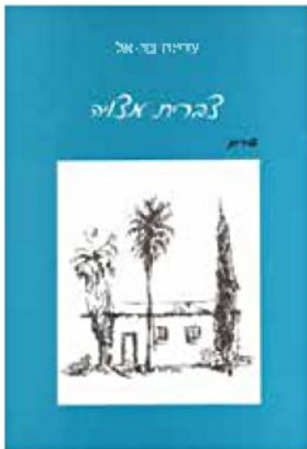
עטיפת הספר "צברית מצויה" (שירים), מאת עדינה בר-אל